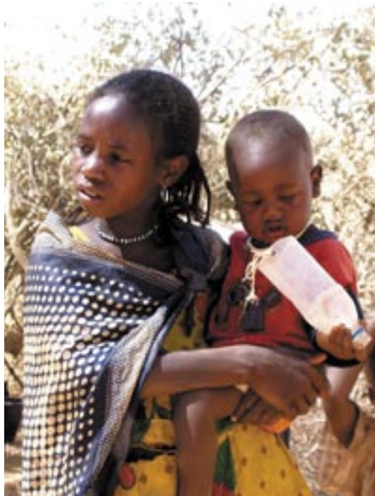
طفلة مشردة في دارفور تعتنى برضيعها

وكانت فرق منظمة أطباء بلا حدود في غرب وجنوب دارفور قد عالجت ما بين تشرين الأول/أكتوبر ٢٠٠٤ وشباط/فبراير ٢٠٠٥ ما يقارب الـ ٥٠٠ امرأة وفتاة، من اللواتي تعرضن للاغتصاب، حيث تعرض ثلثهن تقريبا للاغتصاب المتكرر. وتمثل هذه الأرقام جزءا بالغ الصغر من عدد الحالات الإجمالي التي تحدث على أرض الواقع، حيث أن النساء في السودان، كغيرهن من النسوة في مناطق الصراعات الأخرى، يرفضن الإبلاغ عن الحالات التي يتعرضن فيها إلى ممارسة الجنس بالإكراه خوفا من العزلة والهجر والعار.